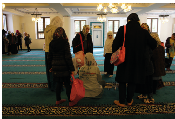
Sehitlik Mosque, Berlin, 2014 – 2015