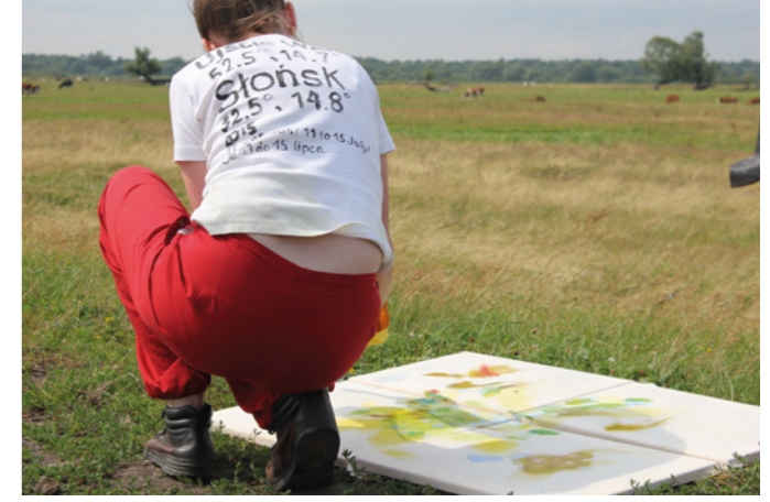
Nationalpark bei Slonsk, Polen, Juli 2015