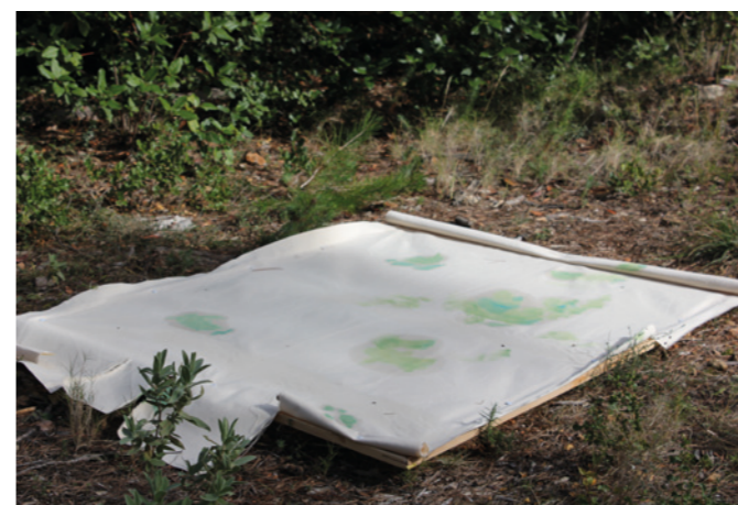
Site-specific Research nach Paul Cézanne. Cézanne malte in der Natur bei Aix-en-Provence. Er malte besonders häufig die Montagne Sainte-Victoire sowie im Steinbruch Bibémus.