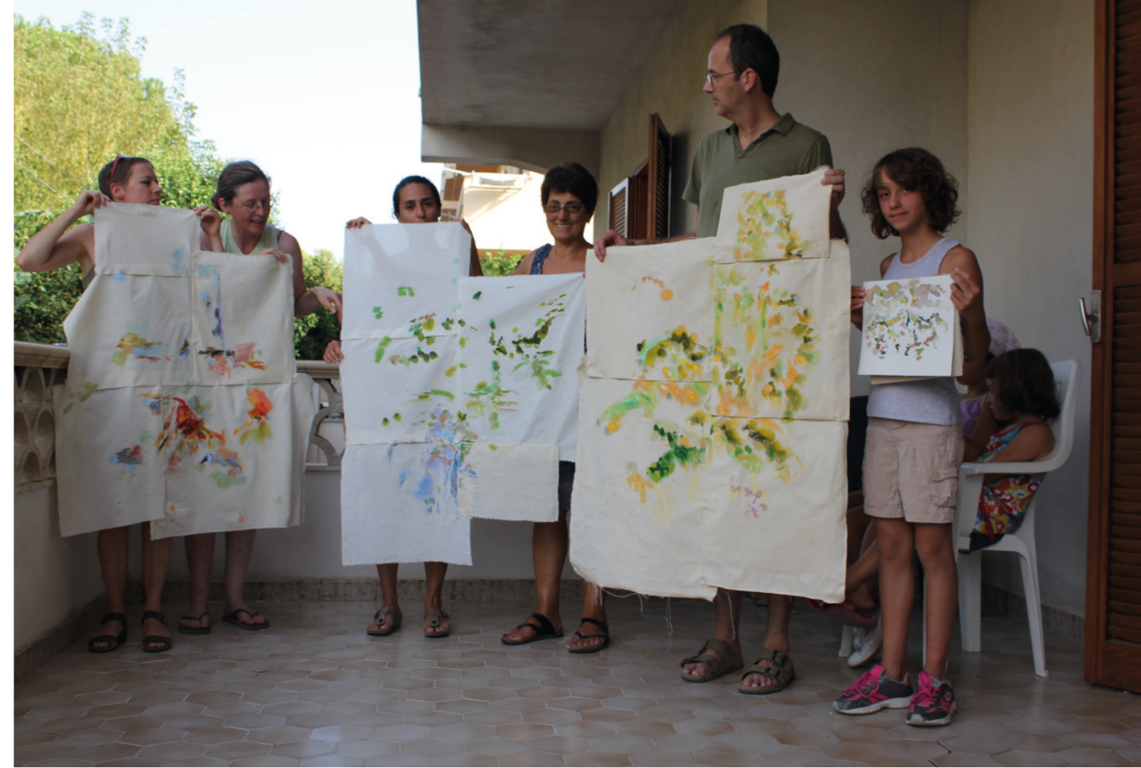
Pietrapaola Paese (Dorf) / Pietrapaola Marina (am Meer), Italien